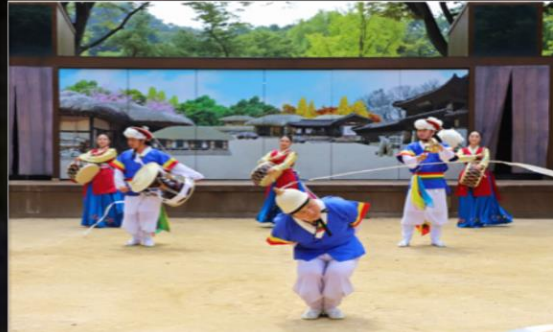
〈삼도판굿〉 농악공연장, 12:30