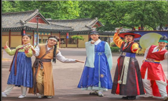
〈어서오시오〉 상가마을, 10:00