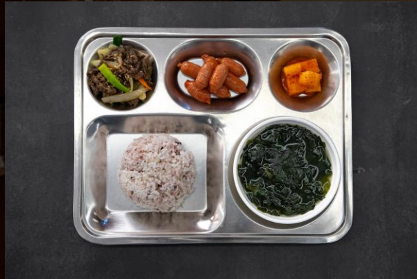
초등/청소년 배식 7,000원