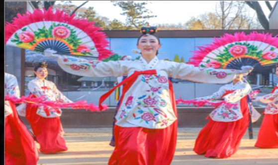
〈풍물한가락〉 농악공연장, 11:30/16:00