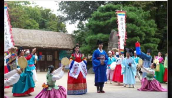
〈백년가약〉 상가마을, 14:00