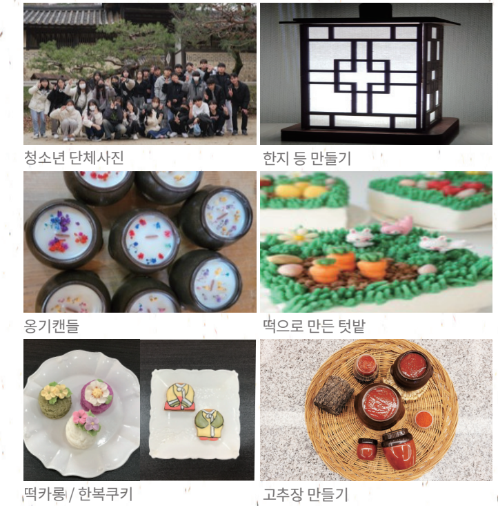
청소년 단체사진 한지 등 만들기 웅기캔들 떡으로 만든 텃밭 떡카롱 / 한복쿠키 고추장 만들기

한국민속촌의 다양한 체험 프로그램을 통해 조선들의 지혜와 생활 모습을 보다 쉽게 이해하고, 문화 예술을 학습할 수 있습니다.